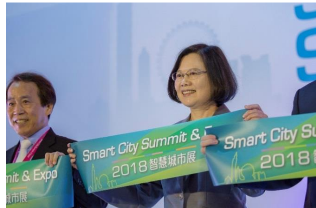
Presidentin Tsai erkennt die Bedeutung von IoT-Technologien für Taiwan an und ist erneut Gast auf der SCSE